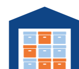
Aufbau eines neuen Logistikzentrums