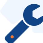
Umbau/Einführung bei laufendem Betrieb